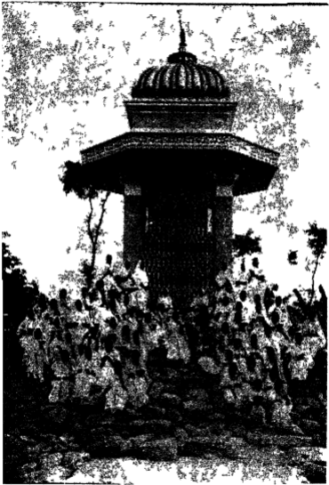
श्रीबाहुबलास्वामीके मन्दिरपर एकत्रित छात्राश्रीका ग्रूप चित्र ।